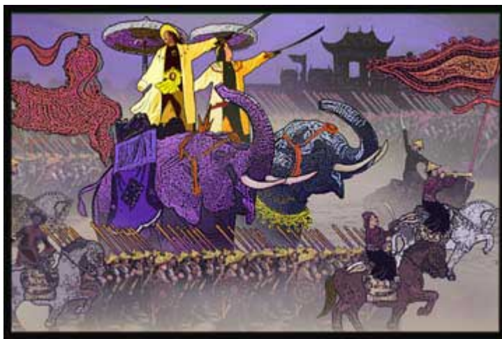
3.- Kết quả cuộc khởi nghĩa: Theo

Cần chú ý, lúc đó Mã Viện đã về hưu trí, nhưng Vua Nhà Hán phải mời Mã Viện ra cầm quân trở lại để bình định cổ Việt, đủ thấy sức kháng cự của Hai Bà Trưng rất mạnh mẽ làm cho nhà Hán phải lo ngại gởi một danh tướng đi đánh dẹp.