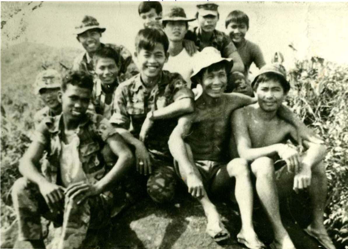
ĐB92 Dù- Quảng Nam 1974 - Club Đâu Mây Chân Gió