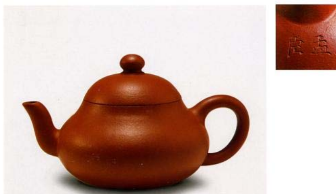
Hình 9: Ấm Mạnh Thần

Về Mạnh Thần, theo chính những hàng chữ viết thì ông sống vào đời Minh Thiên Khải (1621-1627) qua tới đời Sùng Trinh (1628-1644). Ông thường nặn loại ấm nhỏ tròn, khắc chữ bằng dao tre, trong nắp có hai chữ “ Vĩnh Lâm ” bằng chữ triện 6 . Ấm Mạnh Thần chế tạo đa số là ấm chu nê và tử sa, chỉ có rất ít ấm bằng đoạn nê. Các loại ấm cỡ trung và đại cũng hiếm.