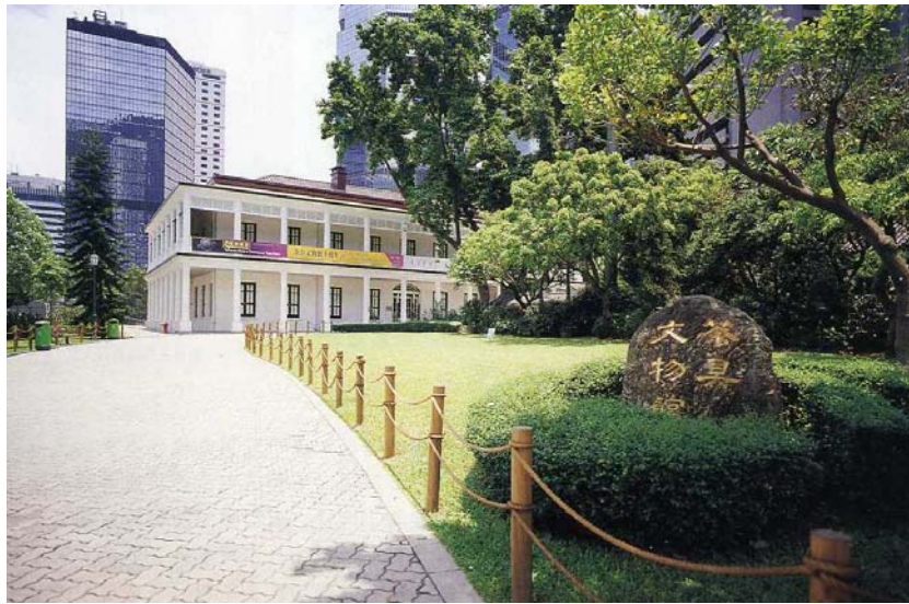
Hình 11: Trà Cự Văn Vật Quán [Hongkong]

Theo những người lão luyện, nếu có nhiều tiền và muốn sưu tầm ấm cổ thì việc đầu tiên là làm quen với ấm, trước hết là vào những viện bảo tàng nhìn ngắm những bộ sưu tập trưng bày trong đó. Tuy nhiên, đó là ở những khu vực đông người Hoa hay tại chính quốc chứ những người như chúng ta thì cũng khó có dịp.