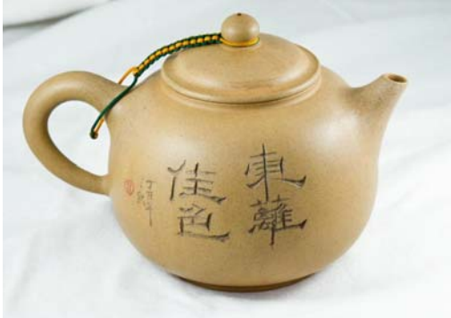
Hình 3: Ấm đoạn nê

Đoạn nê là đất màu vàng, thường có lẫn những tạp chất li ti màu đen. Hiện nay, nhiều ấm màu vàng nhưng không phải là đoạn nê vì tinh khiết quá, màu tươi quá. Đoạn nê thật thường không thuần sắc và cũng không mịn mặt một cách giả tạo. Ấm đoạn nê thường nhỏ, ít khi kiếm được loại to.