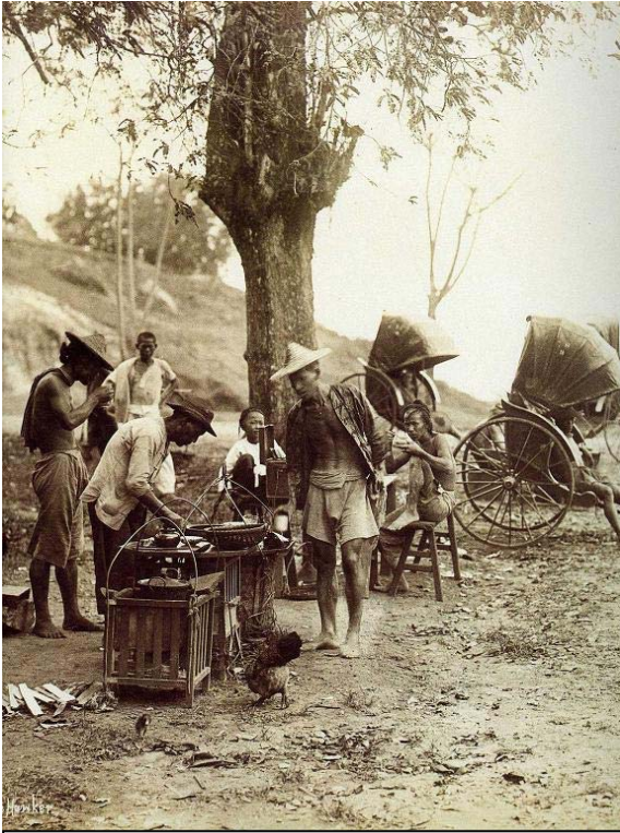
Hình 1: Gánh trà rong ở Quảng Đông

Hầu như đã uống trà thì ai cũng có cách uống riêng của mình, không thể nói ai sành hơn ai. Đối với người Á Đông trà là một sinh hoạt rất phổ thông, vào tiệm ăn thường gia đình nào cũng gọi thêm một ấm trà nóng để làm đồ uống phụ vào bữa chính.