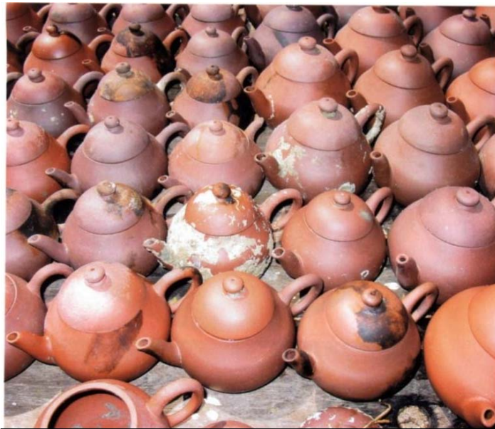
Hình 5: Ấm Nghi Hưng từ thuyền buôn bị đắm

Mỗi người chúng ta có vóc dáng riêng, tiêu chuẩn riêng nên ấm cũng như áo, vừa với người này mà chưa hẳn thích hợp cho người khác. Việc pha trà cũng cần thoải mái nên nếu như ấm có điều bất toàn, trà thủ sẽ không cảm thấy tự nhiên.