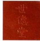
Hình 7: Ấm hiệu Thế Đức Đường

sứ, đồ đất nung là những món hàng được ưa chuộng. Riêng các quốc gia Đông Nam Á, ấm đất được chở sang gồm nhiều hiệu khác nhau nhưng Thế Đức Đường [世德堂] là loại nổi tiếng nhất, kể đó là ấm nhỏ hình quả lê theo hai kiểu Lưu Bội, Mạnh Thần. Khi chọn ấm, phân biệt Thế Đức, Lưu Bội, Mạnh Thần là nhãn hiệu ở đáy ấm, thường là chữ viết hay con dấu. Thế Đức Đường là