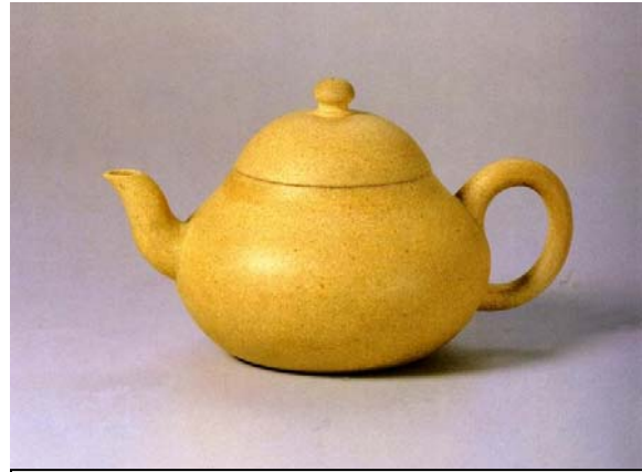
Hình 6: Ấm màu gan gà

Đi sâu hơn, tử sa bao gồm ba loại đất: chu nê [朱泥], đoạn nê [緞泥] và tử sa [紫砂]. Hai màu tím nâu [tử sa] và đỏ [chu nê] thông dụng nhất. Đoạn nê là loại đất màu vàng hơi ngả màu xanh lục. Ấm đỏ ngày nay cũng gọi chung trong tử sa, chu sa hay chu nê chỉ còn để gọi riêng loại đất đỏ thẫm, độ dính cao mà người thợ khéo có thể nặn mỏng như vỏ trứng [egg-shell]. Ấm chu nê dùng một thời gian thì thẫm dần, mỗi khi rót nước nóng vào lại đỏ au lên sinh động chẳng khác gì một con cá lia thia thấy bóng mình trong nước. Có điều đất chu nê đã khai thác hết từ mấy chục năm nay, phần lớn ấm nói là chu nê không phải là đồ thật, ngoại trừ một số danh thủ còn giữ được một số ít để làm những ấm khá đắt tiền.