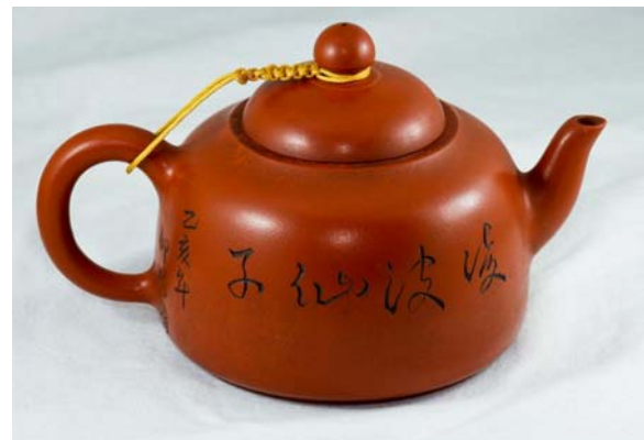
Hình 4: Ấm chu nê

Ngoài ba loại màu chính trên đây, một số màu khác tương đối hiếm hơn, do thiên nhiên cũng có mà do pha chế cũng có, màu trắng, màu xanh dương, màu lục ... với nhiều cấp độ cũng được dùng trong kỹ nghệ làm ấm nhưng không được ưa chuộng bằng.