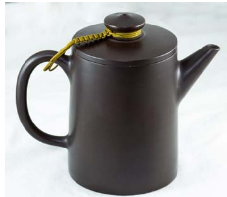
Hình 2: Ấm tử sa

Màu tử sa có nhiều cấp độ, từ đỏ thẫm chuyển sang màu nâu đến màu đen, tuy không đen nhánh như sừng nhưng nhìn kỹ có màu tím than và nếu chẳng may bị vỡ sẽ thấy